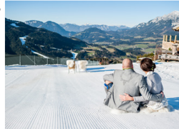
Individuelle, auf das Brautpaar zugeschneiderte Zeremonie Individually personalized ceremony