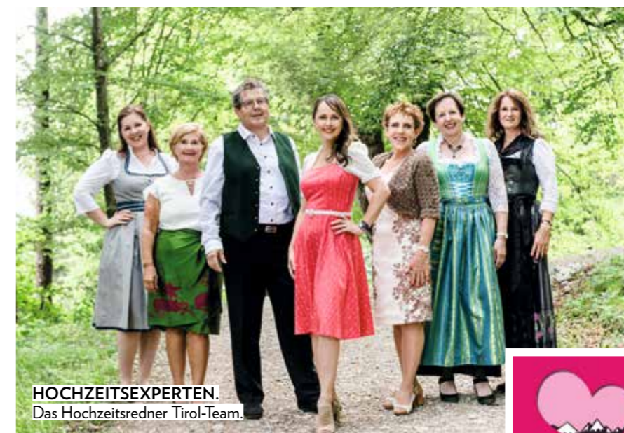
HOCHZEITSEXPERTEN. Das Hochzeitsredner Tirol-Team.