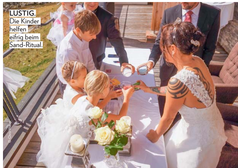
LUSTIG. Die Kinder helfen eifrig beim Sand-Ritual.