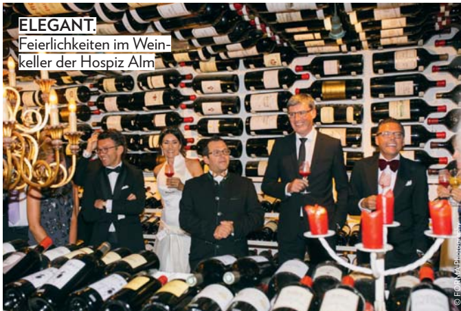
ELEGANT. Feierlichkeiten im Weinkeller der Hospiz Alm